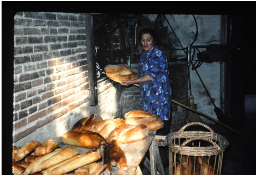
La fournée déposée sur la table du fournil