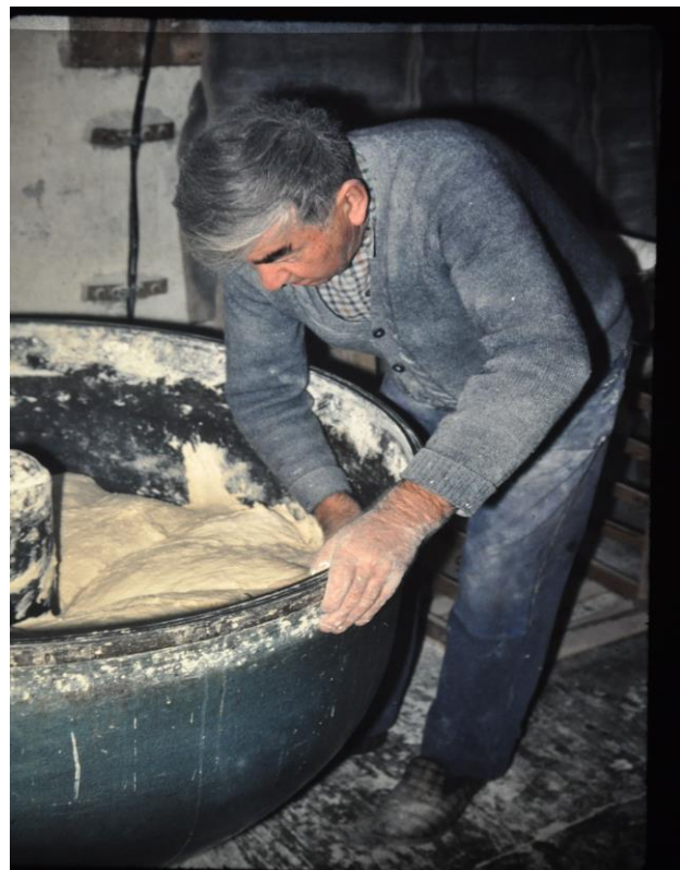
Il accompagne le travail du pétrin