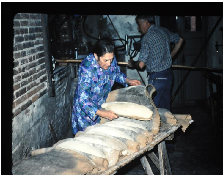
Mise au four des miches