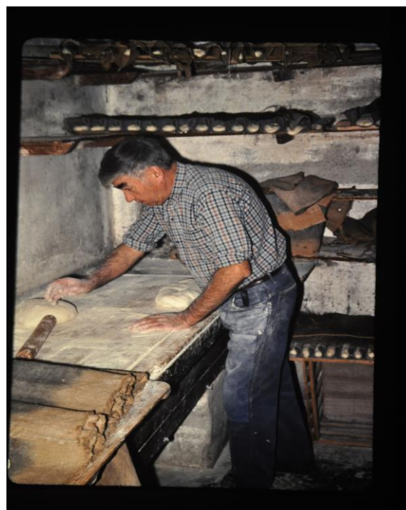
Le façonnage des différents pains