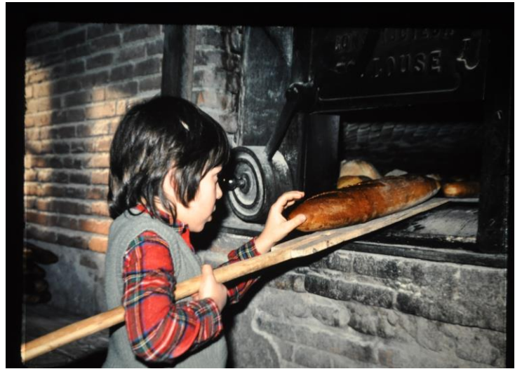
Une aide improvisée