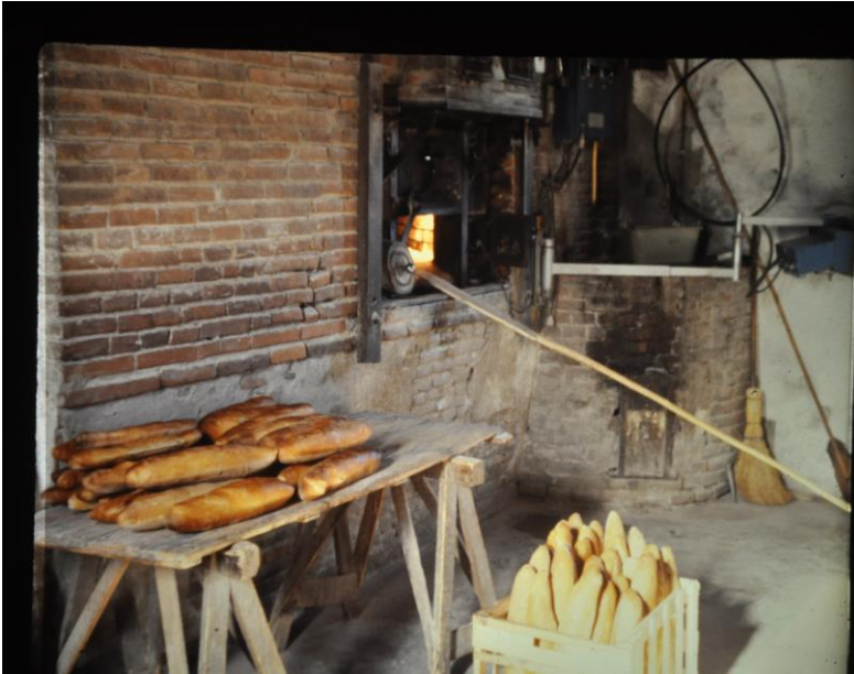
Préparation pour la boutique ou la tournée