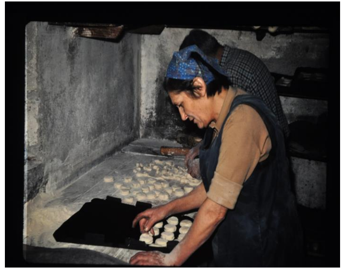
Rangement des "coucous" sur la plaque de cuisson