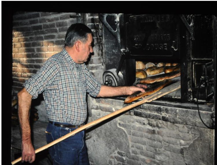
Evaluation de la cuisson