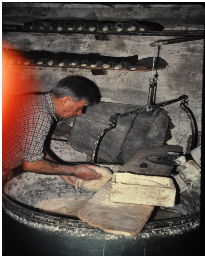
La pesée de la pâte pour chaque futur pain