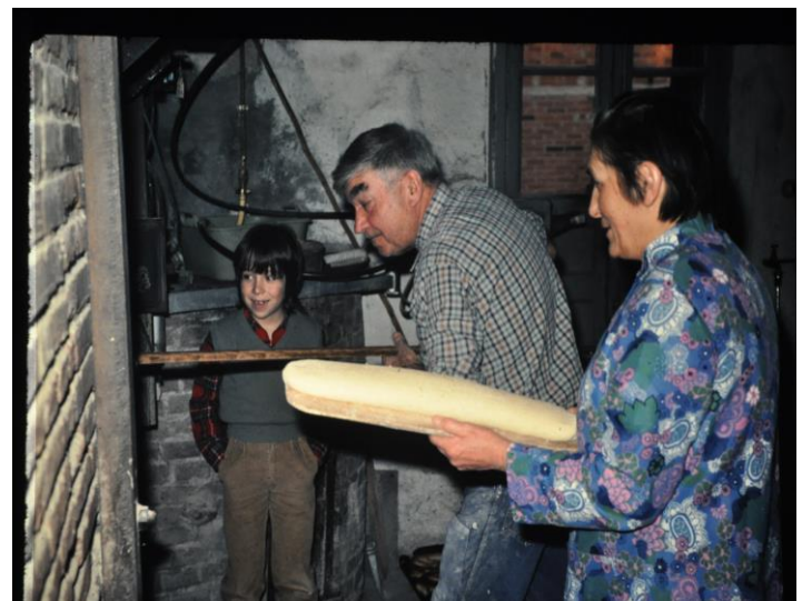
Un petit curieux découvre la mise au four