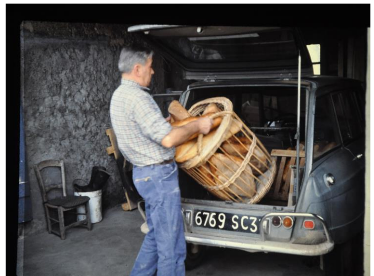
Dernière tournée avec l'Ami 6 Break