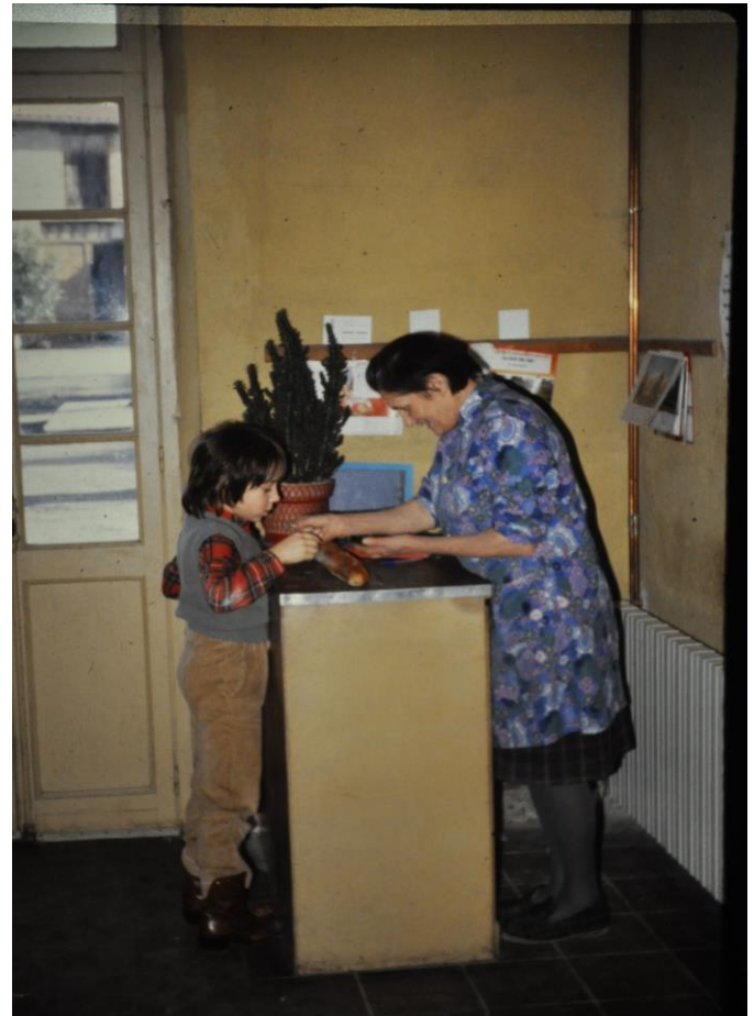
A 8 ans j'achète le pain